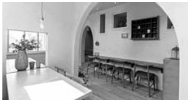
奥に小上がりもある店内の様子

む又は良く食べ良く飲む”を意味します。お陰様で2016年6月のオープンから現在、多くのお客様にお越しいただいています。私は写真のように奮闘していますのでお近くにおいでの際はぜひお立ち寄りください。