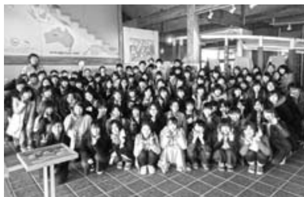
2016年4月新入生オリエンテーション

卒業論文に関しても選択科目ですが、8割以上の学生が履修しています。卒論発表会では1日を目一杯使い30～40題の演題が発表されており、学術集会で発表し奨励賞等を受賞する学生も出てきて今後が楽しみです。人間でいえば小学校に上がる年になりました。たかが6年、されど6年、獣医保健看護学類の歴史がつくられつつあります。今後ご支援のほどよろしくお願い致します。