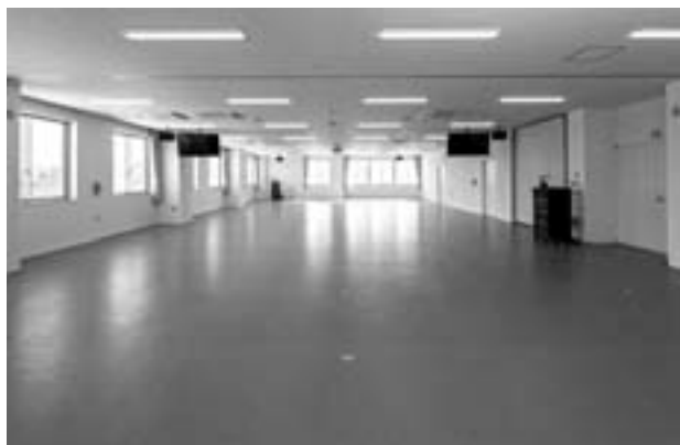
写真1 かなり広々とした VetOSCE 室

まず一つ目は、本年度の4年生から共用試験が実施されます。この試験は全国の全ての獣医系大学で実施されるもので、学生が臨床実習を履修する前に合格しておく必要がある試験です。臨床実習はこれまでの見学型実習から参加型臨床実習へ移行することから、学生の知識、技能、態度等の水準を確保し、社会的な信頼性の保証評価として行われるものです。医学や歯学では平成17年から、薬学では平成22年からすでに開始されています。試験は学科試験（VetCBT：コンピュータを用いたテスト）と、実地試験（VetOSCE：教員による実習試験の評価）の2種類に分かれており、当大学では2017年2月16日と2月21日に記念すべき第1回が予定されています。実地試験に関しては、全学生に同様の課題を課す必要があ