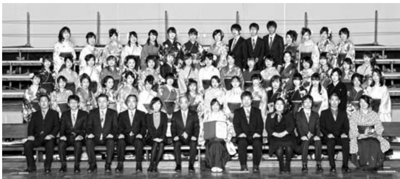
2016年3月学類2期生卒業式記念写真