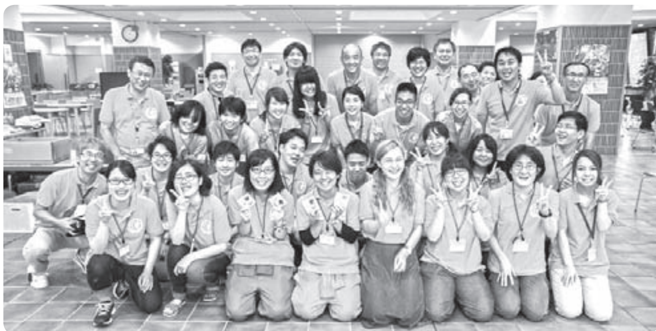
オープンキャンパスにて学生と学長、教職員で記念撮影

末筆ではございますが、全国各地での災害に際し、被害に遭われた方々に心よりお見舞い申し上げます。