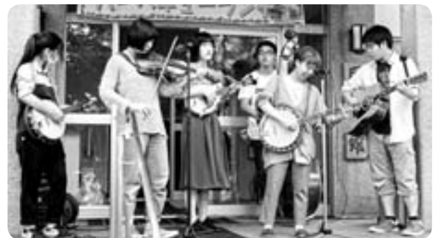
ブルーグラス研究所