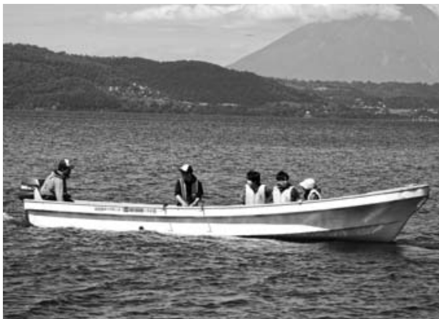
生命環境学コースの実習（洞爺湖町）