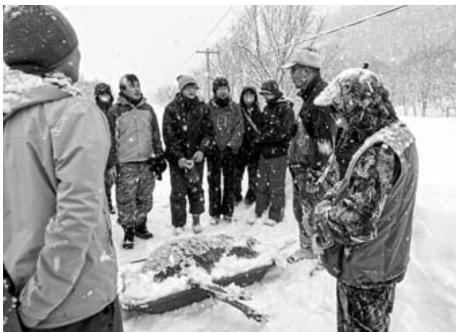
野生動物学コースの実習（西興部村）

グローバル（Globalな視点でLocal）で活躍できる人材育成こそ、環境共生学類の強みである！