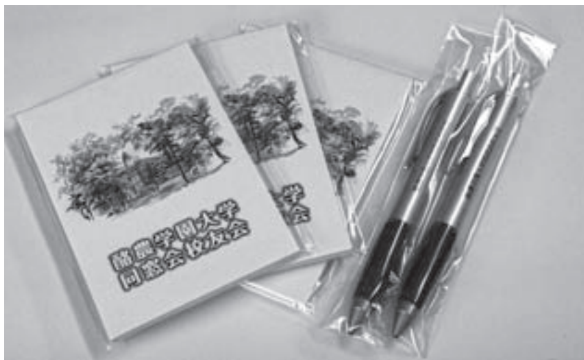
記念品のオリジナルメモ帳とボールペン。同窓生会館に訪問いただいた方やホームカミングデーなどで配布しています

校友会では新しい事業として、母校を訪問された方に贈呈する記念品「名入りのボールペンとメモ帳」を作製いたしました。早速、ホームカミングデーの行事に参加された方々にお持ち帰りいただきました。記念品は今後も同窓生会館でお渡ししておりますので、学園を訪問された際には是非同窓生会館にお立ち寄りいただき、近況などをお聞かせください。