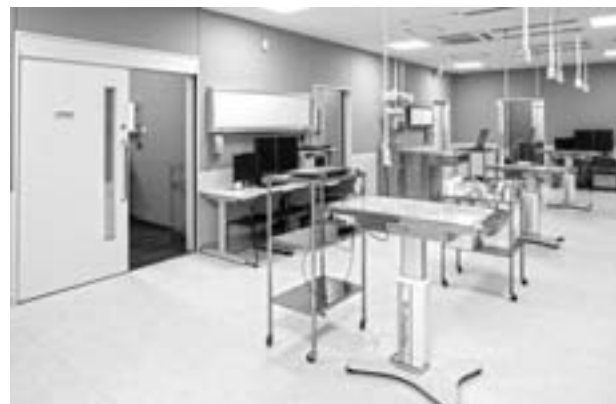
写真2 参加型実習のための広い診療処置スペース（伴侶動物部門）

最後になりますが、今後とも相変わらずのご支援、ご指導を賜りますようお願い申し上げます。また、同窓生皆様のご健勝と益々のご発展をご祈念申し上げます。