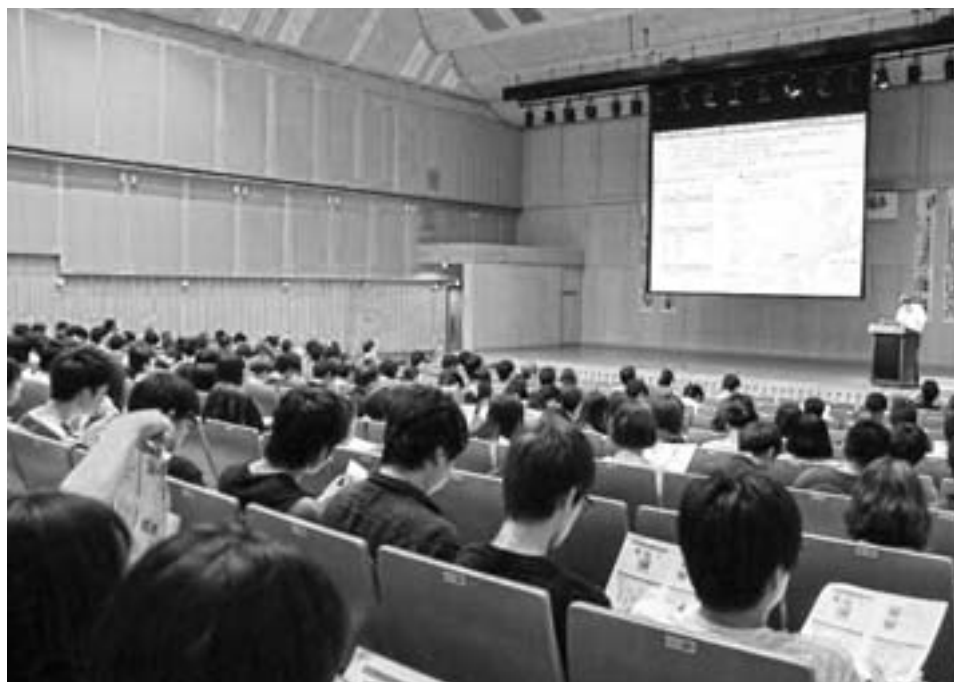
シンポジウム「北海道の食産業の展望と食品研究の新たな取り組み」

食品科学科、食品流通学科ならびに食と健康学類の同窓生の皆様におかれましてはご健康に留意され、ますますご活躍されることをご祈念申し上げます。ならびに今後とも食と健康学類の教育、研究に格段のご理解とご協力のほどよろしくお願いいたします。