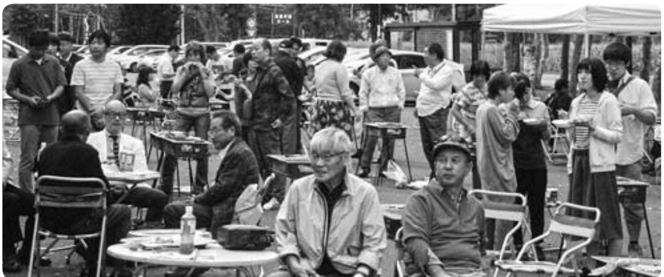
バーベキューランチの様子