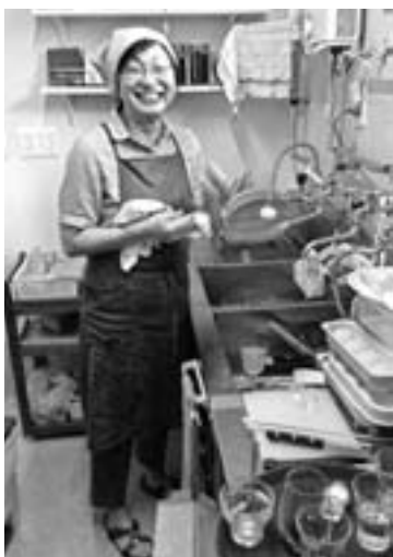
カフェで調理に奮闘中

店名は「cafe & food Bon vivant」と言いますが、フランス語で“人生を楽し